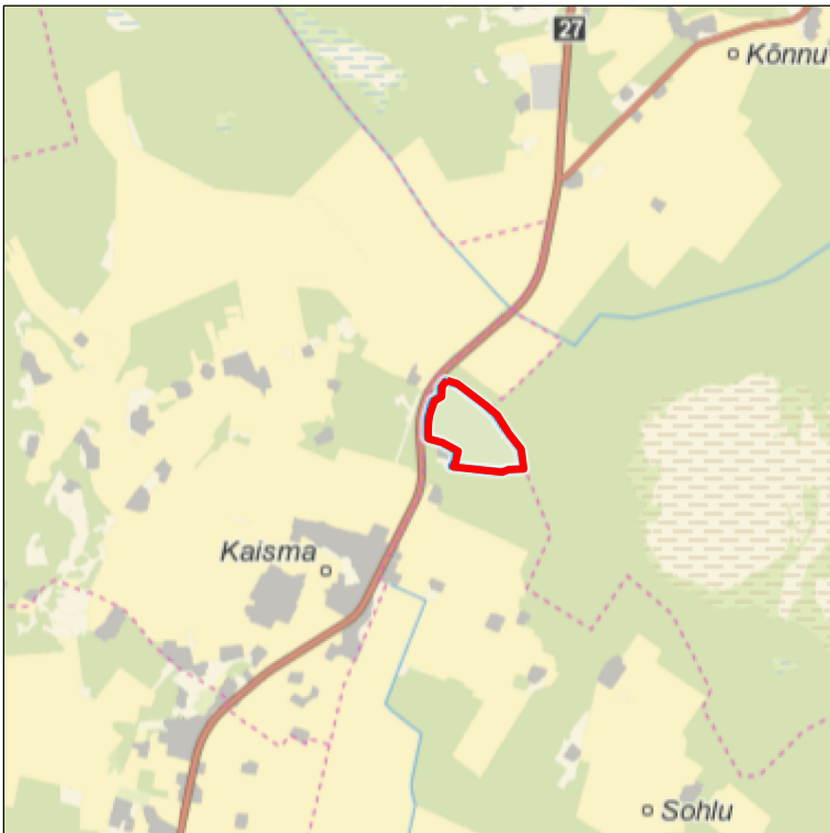
Kaardileht nr 6312 Järvakandi